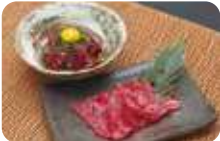
捕鯨の歴史ある山田ならではの鯨肉(ニタリ鯨/商業捕鯨)も人気。