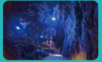
龍泉洞 / 岩泉町