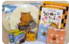
オリジナルマスコット商品もそろろ。