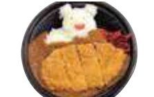
「区界大根カツカレー850円」。大根おろし入りカレーとカツのコラボ。

標高約700mの区界高原で栽培された玄ソバを毎日製粉。つなぎに岩手県産小麦「ゆきちから」を使う二八そば。南部伝統の太目のそば、野趣あふれる風味が持ち味だ。冷たい「区界兜山もりそば700円」はもちろん、「剥きそば」に地元産ナメコが入った温かい「そばの実なめこそば750円」も感動的な旨さ! 深山の恵み、ナメコの風味が堪能できる本物の味だ。