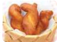
「かぼちゃドーナツ80円」。食堂の隠れた名物。生地から全て手作り。かぼちゃの自然の甘みを感じられ、コーヒーやお茶との相性抜群。

☎ 0193-89-7025 📍 下閉伊郡山田町船越6-141 🕒 9:00～18:00(食堂10:00～16:30) 11～3月は～16:00 ※各30分前LO)