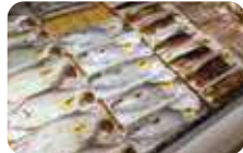
鮮度抜群、値段も格安、魚介類を買うならココ。