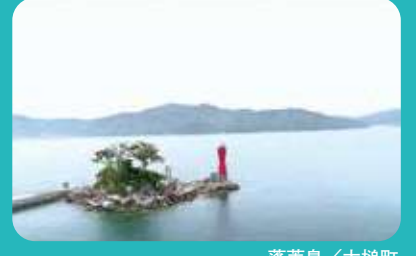
蓬莱島 / 大槌町