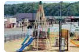
道の駅に隣接する公園「キッズパークたろう」。子供たちに人気大型遊具がありドライブ途中の休憩スポットに。