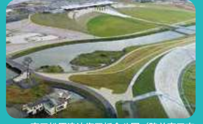
高田松原津波復興祈念公園／陸前高田市