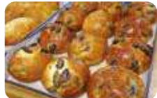
「黒豆パン150円」生地の中には程よい甘さの黒平豆がギッシリ。