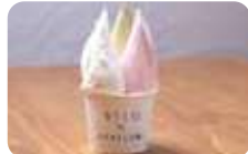
「イワイズミルク」「ピスタチオ」「紅ほっぺ苺ミルク」。