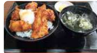
「どんこ唐揚げ丼920円(ワカメスープ付)」。タラにも似た上品な白身が特長の「ドンコ(エゾイソアナメ)」。サクサクの衣とフワフワの食感が特長。お得な各種セットもある。

宮古名物の体験型グルメ「瓶ドン」。店により中身が異なり、善助屋の「瓶ドン ZENUSUKE2,380円」の具材は、ドンコ刺身、イクラ、メカブ、タコなど。瓶のサイズがコンパクトになったZENUSUKEミニ1,200円も人気。