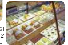
道の駅にある「まつばや餅店」。「大福」「麦まんじゅう」「串だんご」「あずき餅」など昔ながらの変わらぬ味が地元でも大人気。

☎ 0193-77-3305 📍 宮古市田老2-5-1 🕒 9:00〜17:00・年末年始(善助屋食堂 11:30〜15:00・水曜/まつばや餅店 9:00〜18:00・火曜)