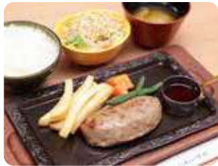
「ハンバーグ定食 1,350円」。岩泉短角牛と龍泉洞黒豚の合い挽き100%のハンバーグ。ジューシー、美味しい…。売店では冷凍ハンバーグ(2個入り 1,520円)も販売。