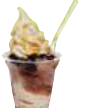
上品な甘さの黒豆ソフトとかき氷のコラボ「シャリシャリブラック400円」。