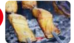
大ぶりの鮭を炭火でじっくりと焼いた「鮭串焼き1本300円」。