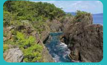
釜石海岸／大船渡市