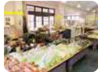
地元産の野菜、花き、山菜、きのこなどがそろった「産直館」。市場価格より安くて新鮮。

☎ 0193-85-5011 📍 宮古市川内8-2 🕒 8:30～17:30 🚗 普通車145台、大型車5台