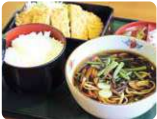
「やまびこA定食1,000円」。黒豆を練り込んだ「黒豆そば(ハーフサイズ)」と、岩手県産四元豚のトンカツのセット。特産の「がっくら漬け」付。

「ドラゴン麺850円」。人気ナンバーワン。玉子とラー油をベースとしたあんかけ辛味噌スープは、辛さ5段階(超激辛、激辛、中辛、小辛)からお好みで。初心者からは中辛あたりから…。