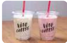
ヨーグルトドリンクは360円。写真は「洋なし」「ストロベリー」。