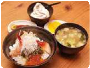
「ぶっかけ海鮮丼1,200円」。イクラ、甘エビ、ホタテ、アカガイ、メカブなどが鮮やかに飾る。粘りがあるメカブは、とろろ飯のようにご飯とかき込んでいただくのがコツ。「ソフト」のデザート付き。

「磯ラーメン800円」。ホタテ、エビ、イカ、シュウリガイ、カニ爪、ワカメをトッピングした人気ナンバーワンメニュー。色鮮やかなワカメ麺を使用。