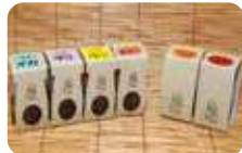
宮古名物の「瓶ドン(冷凍)」も販売している。