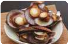
「アカザラガイ」の酒蒸し。火を通すとより旨み際立つ。