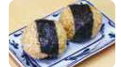
田老のウニでつくる「むしウニ&塩ウニおにぎり1個260円」。