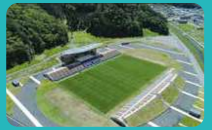
釜石鶴住居復興スタジアム／釜石市