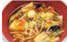
「ダールラーメン850円」。熱々アンのあと引く辛さと旨味が絶妙な名物麺。