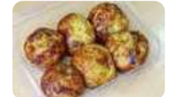
真崎わかめの茎がたっぷり! 「真崎焼き300円(6個入)」。

「真崎焼き」は、田老の名産品「真崎わかめ」の茎がふんだんに入った粉もの。ポン酢orソースの2つの味が選べ、どちらもフワとした生地の中のコリコリとした食感がやみつきになると評判だ。第6回みなとオアシスSea級グルメ全国大会inみやこでグランプリを獲得した道の駅たろう内の「産直とれたろう」イチ押しの商品。