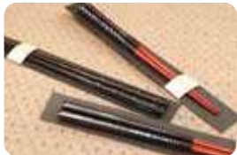
螺旋も美しい「漆塗り箸1,980円」。敷地内に併設される「薬師塗漆芸館」の職人手作りの一品物。二つとして同じものがない。