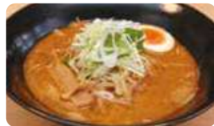
「龍泉洞黒豚味噌ラーメン 850円」龍泉洞黒豚の挽肉入り。コクのある味噌スープの旨さ際立つ不動の人気作。