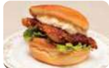
至福の美味しさ。ソースは自家製。「宮古の真鱈フライバーガー350円」。