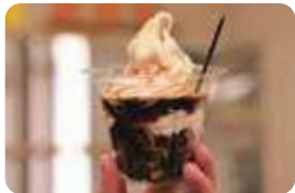
伝統食の進化系。「あずきぱっとソフト350円」。自家製粒あんとは県産小麦を使ったもちもち麺が入った和風ソフト。