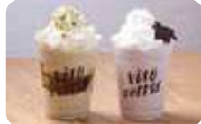
ViTO ならではの味わい。ベラートは7種類。570円〜。