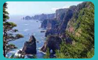
北山崎 / 田野畑村