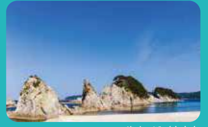
浄土ヶ浜 / 宮古市