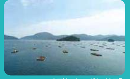
山田湾とオランダ島 / 山田町