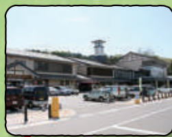
道の駅くじ・やませ土風館