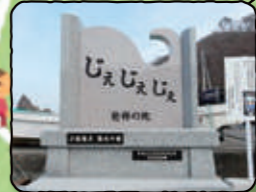
じえじえじえ 発祥の地石碑

監視小屋 ・ヒロシがバイトしていた小屋 ・夏ばっばと春子がアキの素潜りの様子を双眼鏡で見守る場所