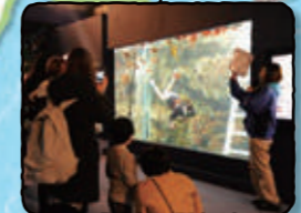
久慈地下水族科学館 もぐらんぴあ