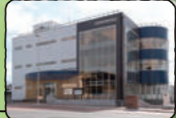
駅前観光交流センター YOMUNOSU~よむのす

久慈駅前・駅前ビル ・北三陸鉄道の開通セレモニーが開催された ・北三陸観光協会が入っていたというビル