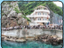
小袖海女センター・夫婦岩

白い灯台 ・若いころの春子が「不満を書きなぐった場所」 ・アキが自転車で飛び込んだ場所 ・最終回でアキとコイが立つ場所