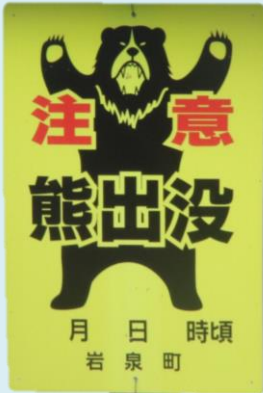
※写真は 御殿崎展望所の注意看板

クマに遭遇したら... / クマに遭遇しないためにも、クマ鈴やラジオなど対策を万全に行いましょう。万が一遭遇したら、大声を出してびっくりさせず、クマに背を向けずにゆっくり立ち着いて後ずさりしましょう。